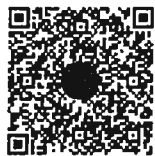
หนังสือนัดประชุม และระเบียบวาระการประชุม ร่วมกันของรัฐสภา

เอกสารประกอบการประชุมร่วมกันของรัฐสภา ได้เผยแพร่ทางสื่ออิเล็กทรอนิกส์ ตามข้อบังคับ การประชุมรัฐสภา พ.ศ. ๒๕๖๓ ข้อ ๑๓ โดยสมาชิกฯ สามารถอ่านเอกสารประกอบการประชุมได้ โดยการสแกน QR code ที่ปรากฏอยู่ในหนังสือนัดประชุม หรือทาง www.parliament.go.th